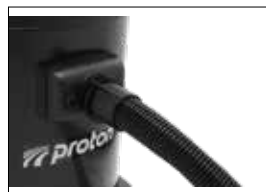
Der flexible Schlauch ist sicher und zuverlässig verriegelt

Le tuyau flexible est verrouillé de manière sûre et fiable