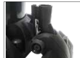
Integrierte Halterung für Bodendüse Support intégré pour buse de terre