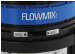
FlowMix – zur Steigerung der Wassersäule um 60% FlowMix – pour augmenter les performances de la colonne d'eau de 60%