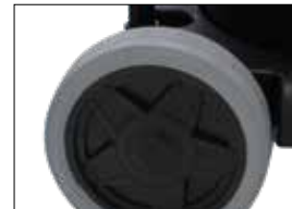
Grosse Hinterräder mit Reifen Grandes roues arrières avec pneus