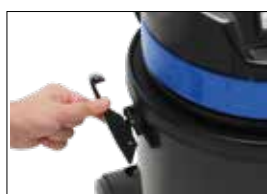
Extrem flexible Klammergriffe