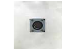
Filtersack mit Sicherheitsventil zur Entsorgung Sac-filtre avec soupape de sécurité pour l'élimination