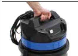
Ergonomischer Griff Poignée ergonomique