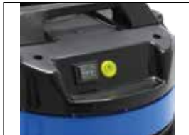
Warnleuchte, wenn Filter verstopft (> 20 m/S) Lumière d'avertissement lorsque le filtre est bouché (> 20 m/S)