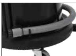
MEC 2/62 NT mit Ablaufschlauch MEC 2/62 NT tuyau de vidange