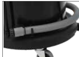
Ablass-Schlauch Tube de drainage