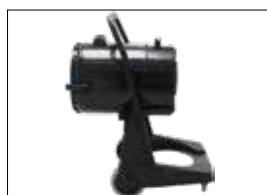
MEC 2/72 NT mit Kippbehälter MEC 2/72 NT avec réservoir basculant