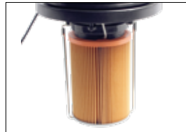
Hocheffiziente H 13 HEPA-Patrone Cartouche H 13 HEPA haute efficacité