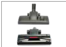
Neue leistungsstarke Düse für eine hohe Reinigungswirkung Nouvelle buse puissante pour une efficacité de nettoyage élevée